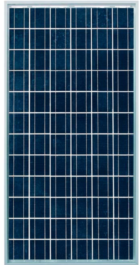
SCHOTT POLY™ 165/170/175/180